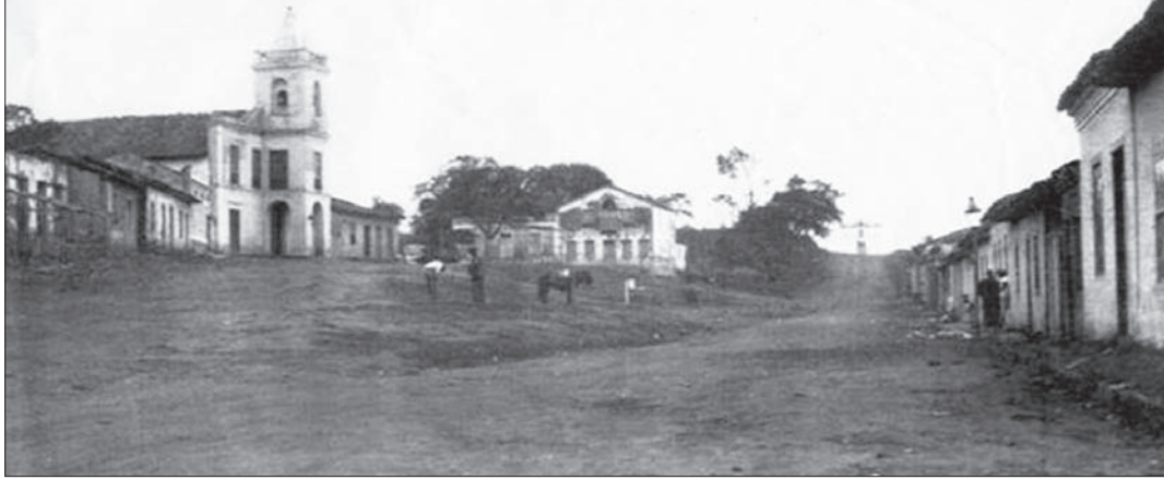
Núcleo Central de Bonsucesso e um dos ramais da antiga "Estrada Geral". Fonte: AHCG. Autoria: Desconhecida, Década de 1930.

... mas o povo cria mais o povo engenha mas o povo cavila o povo é inventalínguas na malícia da maestria no matreiro da maravilha no visgo do improvisado (Haroldo de Campos)