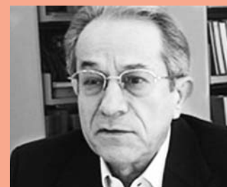
DERMEVAL SAVIANI ANALISA O PLANO DE DESENVOLVIMENTO DA EDUCAÇÃO